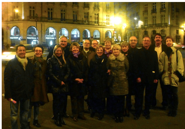
Le joyeux groupe de mécènes sur la place royale.

Pour que cette aventure puisse avoir lieu, le club Concert'O a soutenu l'Orchestre de Pau à hauteur de 7000€ en finançant le déplacement en cars et la restauration des musiciens.